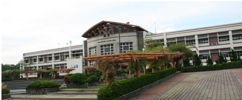
Gambar 0.1 Tampak depan gedung utama PCR

Kampus PCR berdiri pada tahun 2001. Program Studi yang terdapat di PCR yaitu Teknik D3 Elektronika, D3 Teknik Komputer, D3 Teknik Telekomunikasi, D3 Teknik Mekatronika dan D3 Akuntansi serta Sistem Informasi, D4 Teknik Informatika dan D4 Teknik Elektronika Telekomunikasi, D4 Teknik Mesin, D4 Teknik Listrik dan S2 Terapan Teknik Komputer. Politeknik Caltex Riau tercatat sebagai Perguruan Tinggi Vokasi Swasta terbaik di Indonesia. Catatan peringkat ini diambil berdasarkan data dan rilis resmi Kemenristekdikti tahun 2015, 2016, 2017 dan 2019. Gambar 2.1 dibawah merupakan tampak depan dari gedung utama politeknik caltex riau.