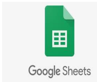
Gambar 2.6 GoogleSheet

GoogleSheets adalah aplikasi web untuk membuat, mengedit, dan berbagi spreadSheet secara Online . Mendukung file Excel, CSV, dan dapat disimpan sebagai HTML. Google Sheets juga menyediakan Google Apps Script (GAS) , sebuah bahasa pemrograman berbasis JavaScript untuk mengotomatiskan tugas di layanan Google dan pihak ketiga, yang dijalankan di cloud Google (Nurlaily et al., 2022).