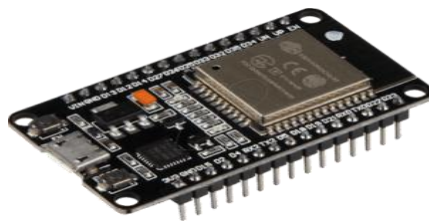
Gambar 2.7 Mikrokontroler ESP32

ESP32 adalah mikrokontroler serbaguna dengan konsumsi daya rendah, yang dilengkapi dengan Wi-Fi dan Bluetooth Low Energy (BLE). Sebagai penerus ESP8266, ESP32 menawarkan berbagai peningkatan di semua aspek. Selain mendukung konektivitas Wi-Fi, ESP32 juga memiliki kemampuan Bluetooth Low Energy, menjadikannya lebih fleksibel. CPU yang digunakan ESP32 mirip dengan ESP8266, yaitu Xtensa LX6 dengan arsitektur 32-bit, namun kelebihan utamanya adalah adanya inti ganda. Selain itu, ESP32 memiliki ROM 128KB, SRAM 416KB, dan Flash Memory sebesar 64MB untuk menyimpan program dan data (Prafanto et al., 2021). Di bawah ini adalah gambar 2.6 yang menunjukkan dari ESP32.