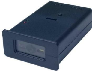
Gambar 2.4 Scanner QR Code (GM66)

GM66 adalah modul pemindai barcode dan QR Code berbasis kamera yang digunakan untuk membaca QR Code secara otomatis. Dalam sistem monitoring pemupukan kelapa sawit, GM66 berfungsi sebagai alat identifikasi node, yaitu membaca ID pohon dari QR Code dan mengirimkannya ke mikrokontroler (ESP32) melalui komunikasi serial. Penggunaan GM66 membantu mempercepat identifikasi pohon dan mengurangi kesalahan input data saat proses pemupukan. Setiap pemilik usaha diharapkan mampu memanfaatkan Teknologi informasi untuk mendukung kelancaran operasional dan menghasilkan informasi yang cepat serta akurat. Penggunaan sistem manual yang masih mengandalkan buku dan kertas berisiko tinggi terhadap hilangnya data, terutama bagi perusahaan besar dengan banyak karyawan. Pencatatan secara manual menggunakan buku dan pulpen menjadi kurang efisien dan tidak praktis (Equila & Sholihin, 2023).