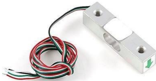
Gambar 2. 11 Bentuk Fisik Load Cell

Load Cell yakni unsur pokok dalam sistem timbangan digital (Limasari, 2009), prinsip kerja dari timbangan digital yaitu memberi keluaran berupa tegangan dari transformasi resistansi yang diakibatkan oleh berubahnya keadaan atau kedudukan penyangga beban hingga perubahan itu perlu dimasukkan ke dalam amplifier supaya bisa diperoleh tegangan yang mampu dibaca ADC controller lalu datanya akan ditunjukkan di layar LCD. Untuk bentuk dari Load Cell dapat dilihat pada Gambar 2.6.