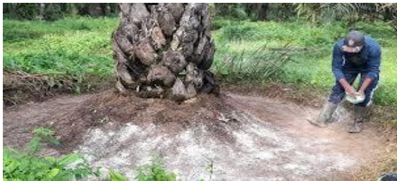
Gambar 2.2 Pemupukan Kelapa Sawit

Pupuk merupakan sumber utama unsur hara bagi tanaman yang berperan penting dalam menentukan tingkat pertumbuhan dan produksi. Hal ini disebabkan oleh keterbatasan kemampuan lahan untuk secara terus-menerus menyediakan unsur hara yang diperlukan oleh kelapa sawit, yang memiliki umur panjang. Oleh karena itu, untuk mengatasi keterbatasan daya dukung lahan dalam menyediakan unsur hara, penambahan pupuk diperlukan untuk memenuhi kebutuhan hara tanaman (Ega Aprilia., 2020). Pemupukan adalah salah satu kegiatan krusial dalam perkebunan kelapa sawit yang memerlukan biaya besar, sehingga penting untuk mencari cara-cara yang dapat meningkatkan efektivitas dan efisiensi pemupukan (Siahaan et al., 2023).