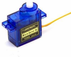
Gambar 2. 10 Bentuk Fisik Motor servo

Motor servo yakni motor yang bisa bekerja secara dua arah yakni clockwise serta counter clockwise . Arah serta sudut pergerakan dari motor servo bisa dikontrol hanya melalui pemberian aturan duty cycle sinyal PWMdi bagian pin control sebagaimana ditunjukkan melalui Gambar 2.4.