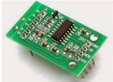
Gambar 2.8 Modul HX711

menjadi bentuk sinyal digital. Pada proyek akhir ini modul HX711 digunakan untuk memberikan hasil pembacaan dari sensor Load Cell yang lebih presisi.