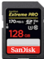
Gambar 2. 5 SD CARD