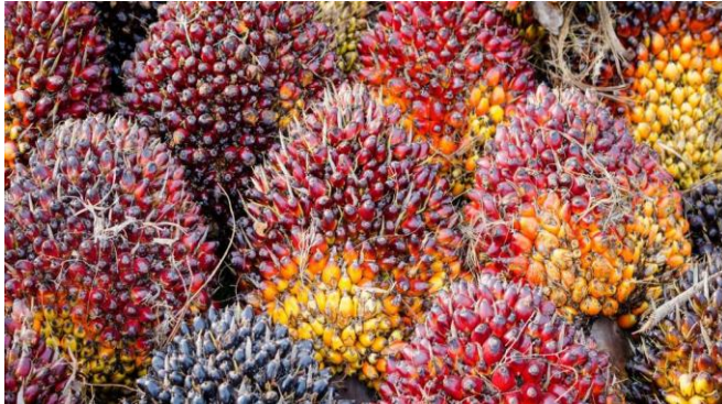
Gambar 2.1 Kelapa Sawit

Kelapa sawit ( Elaeis guineensis Jacq) adalah komoditas yang memiliki bagian yang bernilai ekonomi, yaitu buahnya. Buah kelapa sawit tumbuh dalam tandan buah segar (TBS). Buah kelapa sawit diolah menjadi minyak kelapa sawit mentah (CPO) dan minyak inti sawit (PKO). Kedua jenis minyak ini memiliki berbagai manfaat dan umumnya digunakan sebagai bahan baku untuk industri seperti pembuatan mentega, sabun, kosmetik, tekstil, biodiesel, dan lainnya. Luas areal kelapa sawit di Indonesia pada periode 2019-2021 tercatat secara berurutan sebesar 14.456.600 ha, 14.858.300 ha, dan 14.665.000 ha. Produktivitas CPO di Indonesia adalah 3.732 Kg/Ha. Produktivitas ini 49,76 persen lebih rendah dibandingkan dengan potensi maksimalnya, yang mencapai 7,5 ton per hektar (Siahaan et al., 2023).